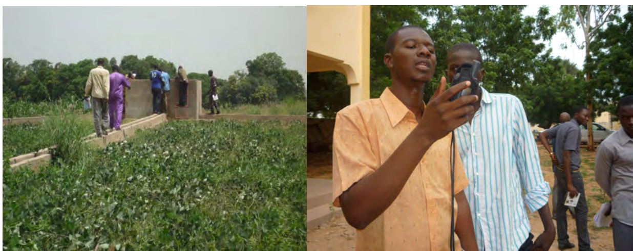
Bassin de collecte de l'eau de la station de pompage collectif du PM d'association Djèkabara, village de Samé-Plantation, commune de Samé-Diongoma, cercle de Kayes sur lequel le test a eu lieu.

Les superviseurs ont rencontré les préfets des cercles de la région pour informer et expliquer la teneur de la mission d'inventaire et présenter le PNIP. Par ailleurs chaque préfet a reçu un document du PNIP.