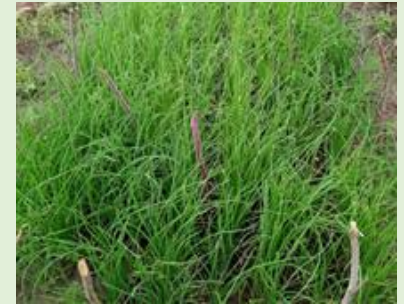
Pépinière d'oignon d'hivernage