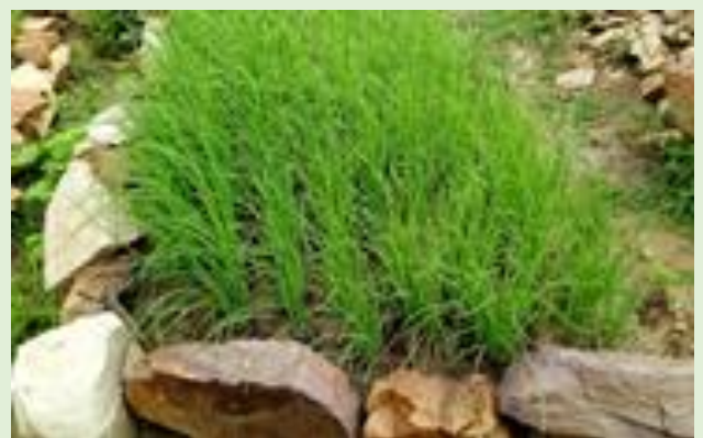
Pépinière d'oignon d'hivernage de planche bombée