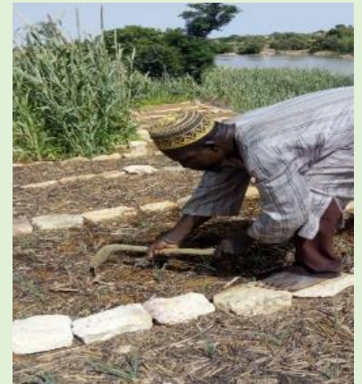
Binage à Doumbogou