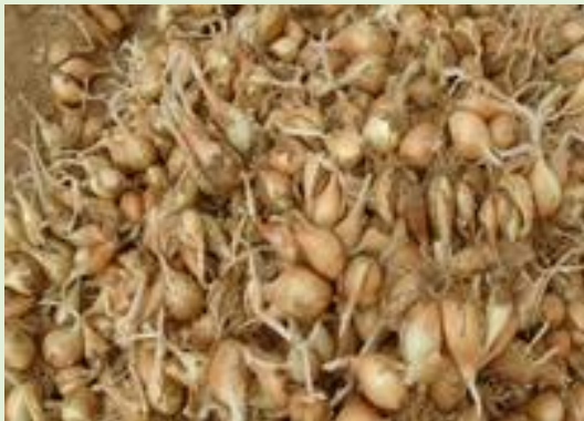
Produit récolté échalotes

« Nous n'avons jamais produit autant de kilogrammes d'échalote avant votre arrivée sur de telles superficies dans le passé et à moindre coût surtout » [beneficiaires].