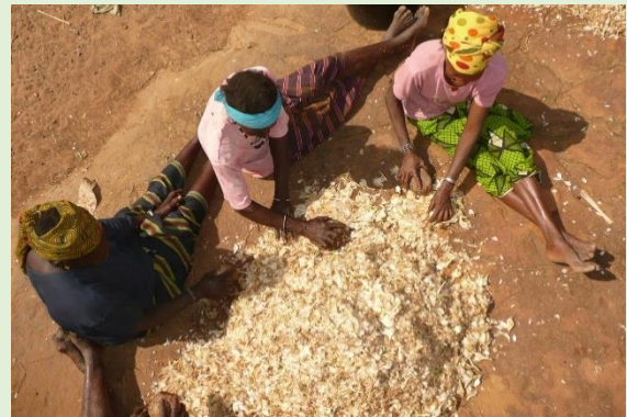
Transformation Échalote Bandiagara