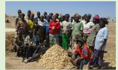
Récolte d'échalote Terely Daga