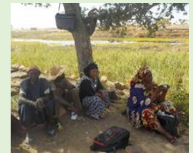
Semis de l'échalote à Golgou