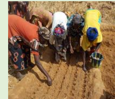
Porteurs de parcelle CEP à Dobo