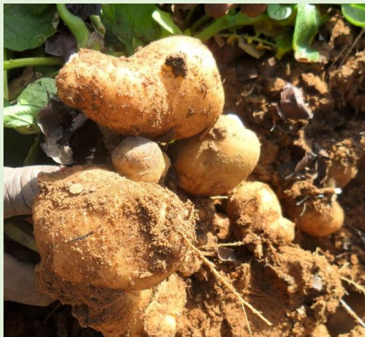
Parcelle de démonstration – pomme de terre