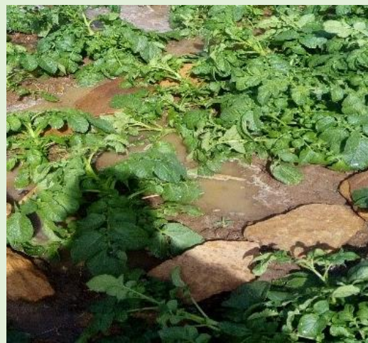
Parcelle de démonstration – pomme de terre