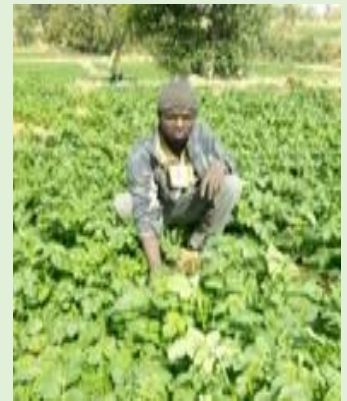
Parcelle de pomme de terre à Andjumbolo