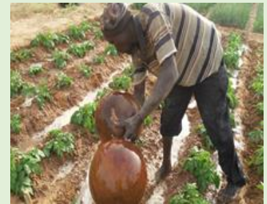
Arrosage parcelles de pomme de terre