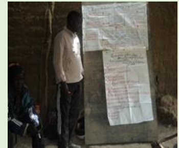
Séance de formation à Dobo