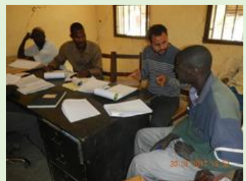
Signature du protocole tripartite à Pélinga