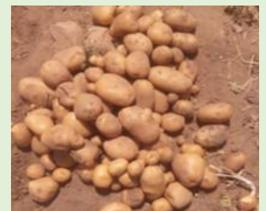
Récolte de pomme de terre tion des superficies.